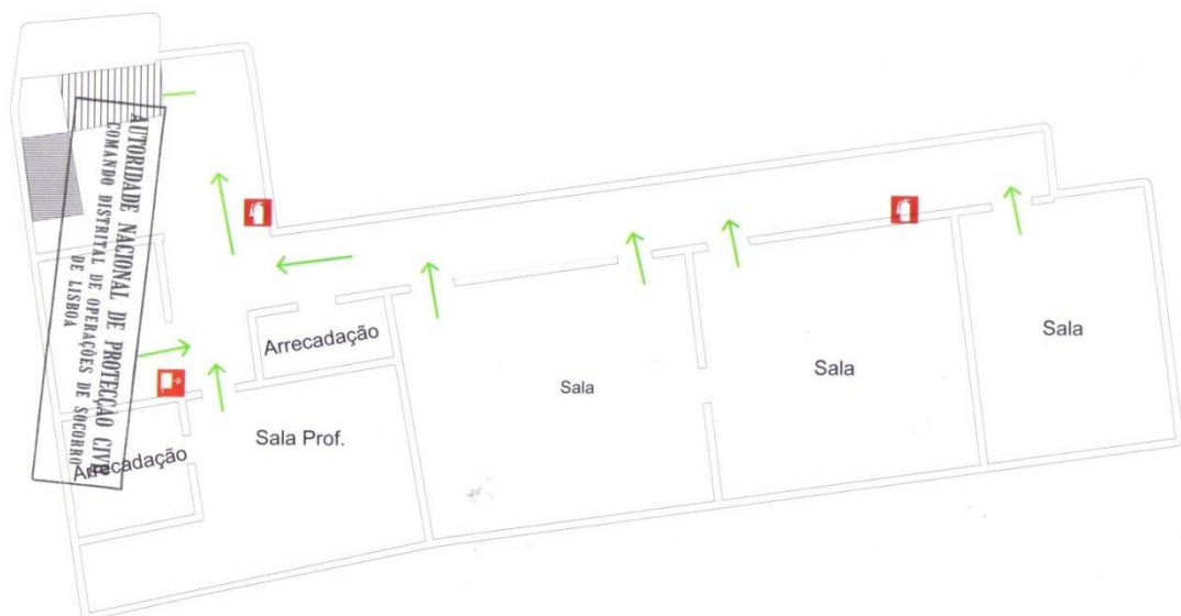
Figura 3: Planta do piso superior da escola.