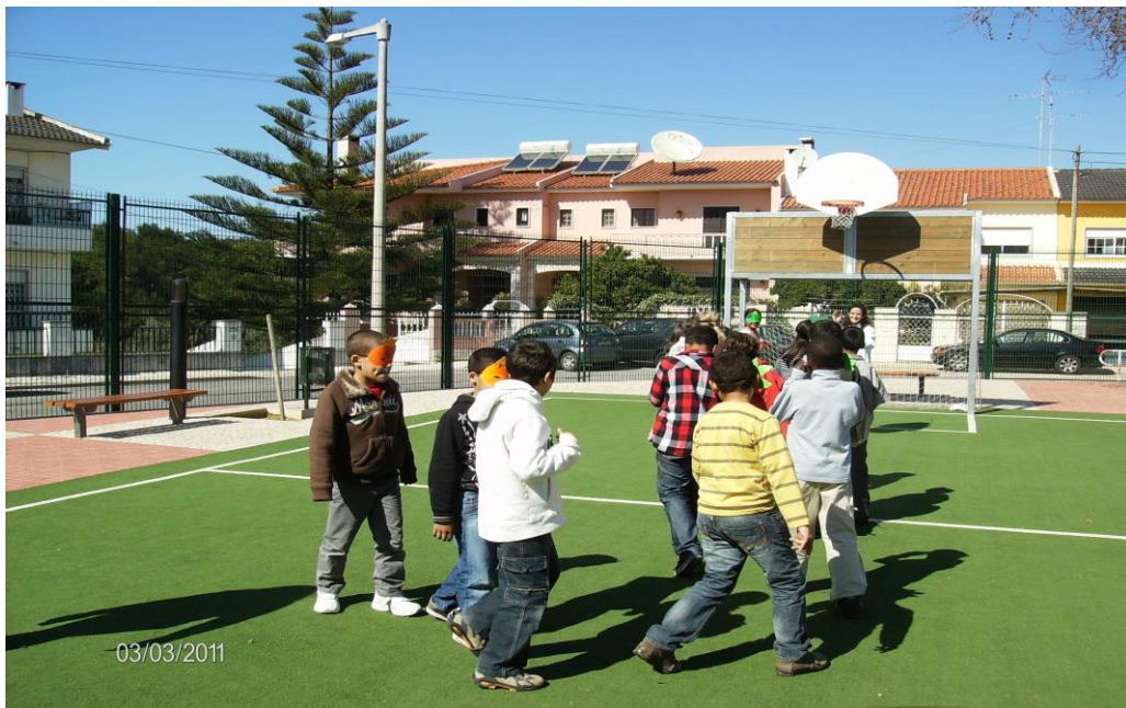
Figura 4: Vista parcial do campo de jogos em relva sintética.