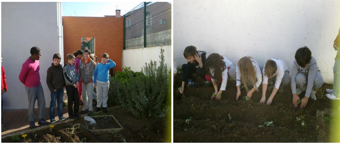
Figura 5: Alunos em atividades agrícolas.